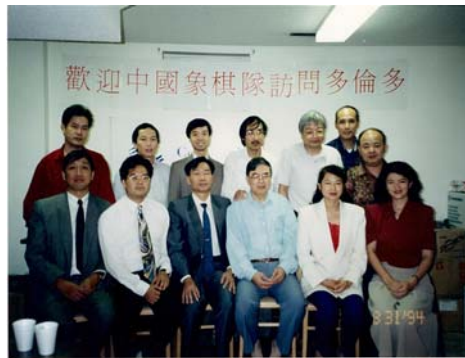
1994 蔡福如，柳大华访问多伦多