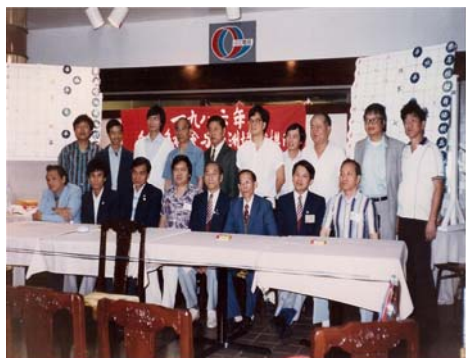
1986 亚洲名星队访问多伦多