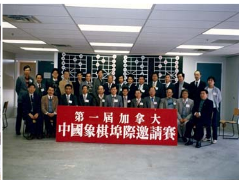
1987 纽约多伦多埠际赛