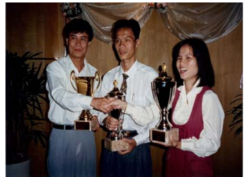
1995 世界冠军吕钦和黄玉莹

多象棋会20多年来曾多次邀请中国象棋全国冠军及特级大师进行访问及表演。除广为人知的杨官麟、胡荣华及蔡福如外，还包括：柳大华、吕钦、徐天红、赵国荣及陶汉明等。对多伦多中国象棋的推广、普及贡献良多。多伦多象棋队有一名非华裔成员BILL BRYDON，他2014年将代表多伦多参加在新加坡举办的世界非华裔象棋邀请赛。多伦多象棋会发展至今属下已有奥拉玛市和万锦市两个分会，10多年来与士嘉堡耆英象棋会也保持着良好的合作关系，目前他们仍在积极开拓其他地区。