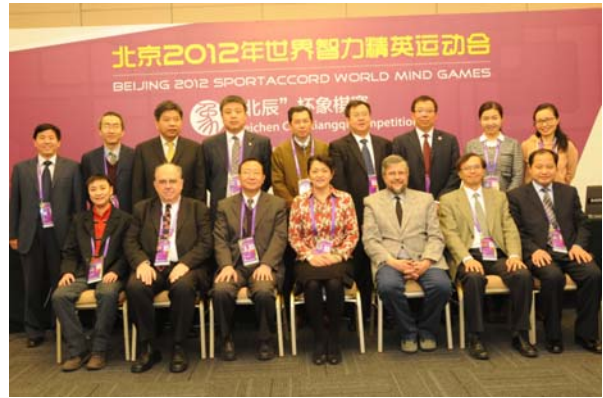
右图：裁判人员合影