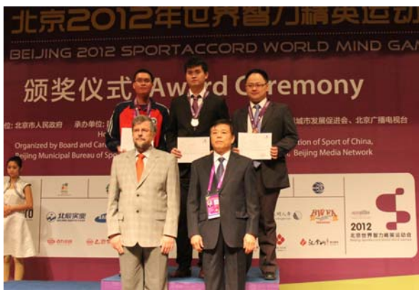
左图：男子颁奖仪式